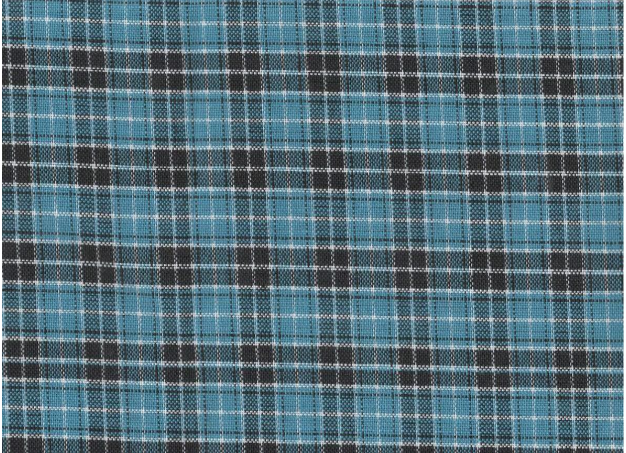
Kielelezo cha sare ya darasani (Skirt)